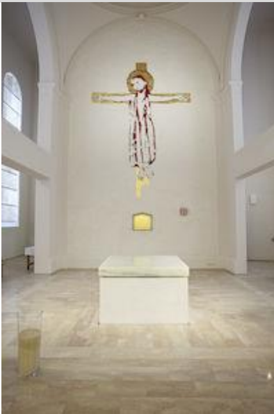
Kirche im Augustinum